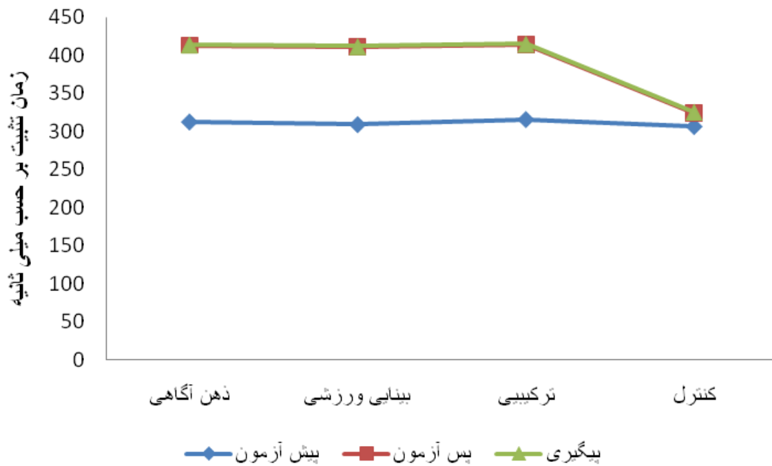
شکل ۲. تغییرات زمان تثبیت در سه مرحله پیش آزمون، پس آزمون و پیگیری